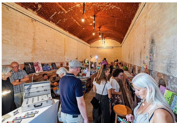
Der ehemalige Sulzer-Ofen entpuppt sich als der kühlsche Ort auf dem Platz.

was zu bösen Hautreaktionen führen kann.»