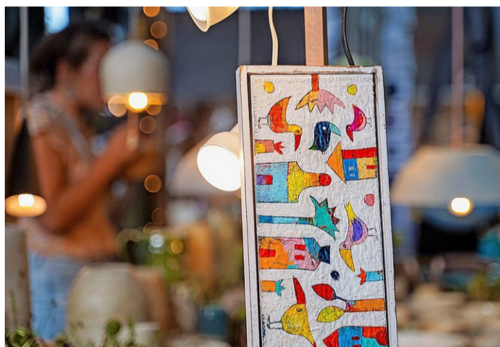
Doris Kummer malt fröhliche Bilder in Mischtechnik – eines von vielen Angeboten auf dem Bazar.